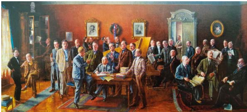
Saša Šantel, Slovenski skladatelji, 1936

Impozantno olje na platnu Slovenski skladatelji iz leta 1936 v Dvorani Slavka Osterca Slovenske filharmonije spada med največja dela slovenskega tabelnega slikarstva. Slikarju Saši Šantlu (1883–1945) je delo naročila ljubljanska Glasbena matica oziroma njena podružnica Filharmonična družba ob prenovi filharmonične stavbe po načrtih arhitekta Jožeta Platnerja. Izvrsten portretist Šantel je naslikal ‚koncil slovenske glasbe‘, saj je v likovno delo združil slovenske glasbene ustvarjalce od najstarejših obdobjih do sodobnosti in jih premišljeno razporedil v skupine po generacijah in slogovnih usmeritvah. Sijajno je premagal številne slikarske izzive in v enoten prostor harmonično in z vtisom družabnega srečanja združil med seboj sicer zelo raznolike glasbene osebnosti različnih dob. Njegova predpriprava na veliko figuralno kompozicijo velikosti 5 x 2,5 m so bili posamični portreti skladateljev (serijo skladateljskih portretov je že ustvaril v lesorezni tehniki in več kot 100 risbah). Na veliko platno je v sodelovanju z naročnikom uvrstil 37 oseb. V ozadju so skladatelji starejših obdobjih, v ospredju pa sodobniki. Pokazal je odlično poznavanje njihovih estetskih idealov, značajev, medsebojnih odnosov ter vpetost v slovensko glasbeno